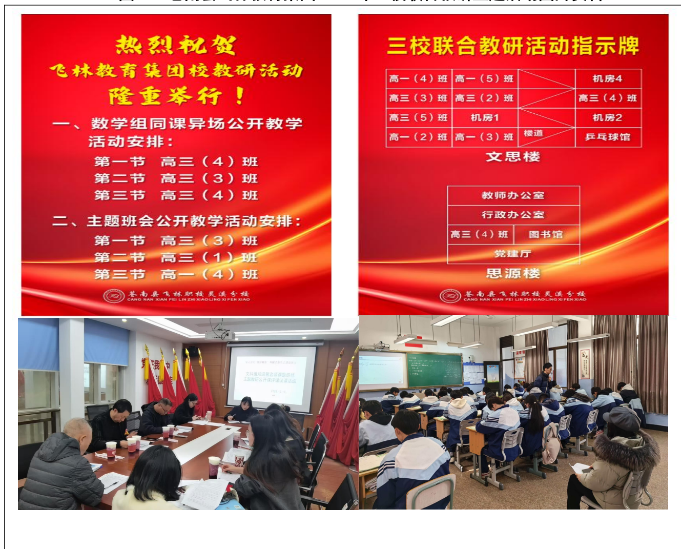
图 5：苍南县飞林教育集团 2025 年三校联合教研主题活动图片资料

比赛全过程坚持“公开透明、优中选优”原则，对获奖教师进行表彰宣传，组织其分享教学经验；赛后召开教学沙龙，深度剖析优秀教学案例，引导教师对标先进、查找差距，主动学习先进教育理念与教学方法，形成自主学习、争先创优的良好氛围。