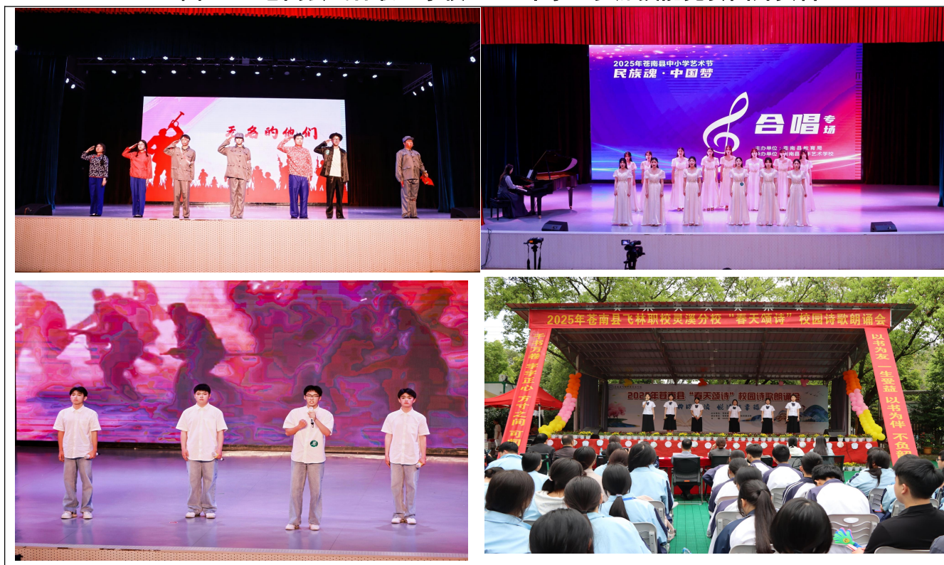
图 3：苍南县飞林职业学校 2025 年学生参加技能竞赛图片资料

文化活动与专业培养深度融合，学生在文艺展演、技能竞赛中屡获佳绩，职业素养与人文素质同步提升。文化讲座、企业研学等活动，让学生提前认知岗位文化，为就业创业奠定坚实基础。