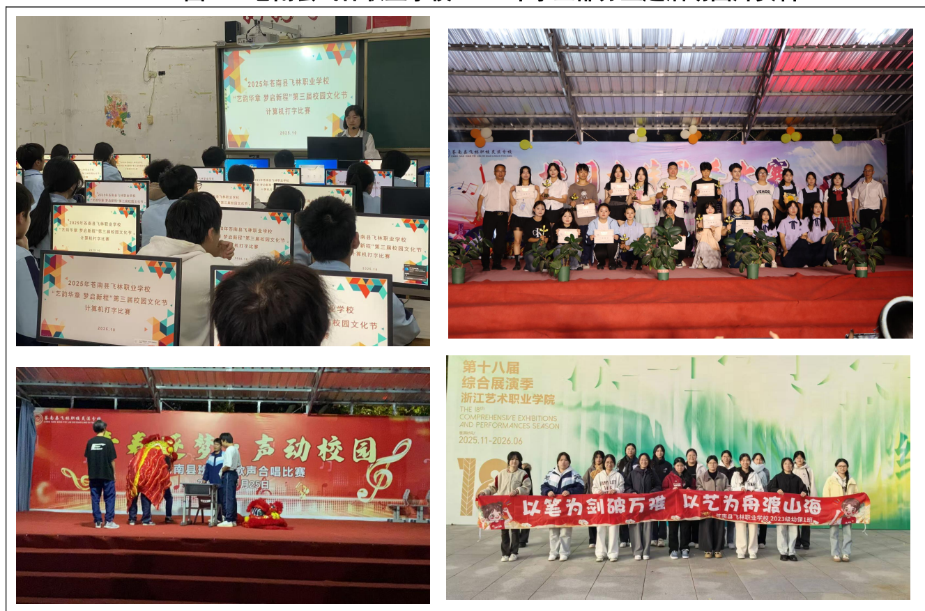
图 1：苍南县飞林职业学校 2025 年学生部分主题活动图片资料

同时，结合校纪校规教育月、清明节、国庆节等重要时间节点，开展主题征文、清明祭扫等活动，将针对性教育与节点教育有机融合，让德育在潜移默化中浸润学生心灵。